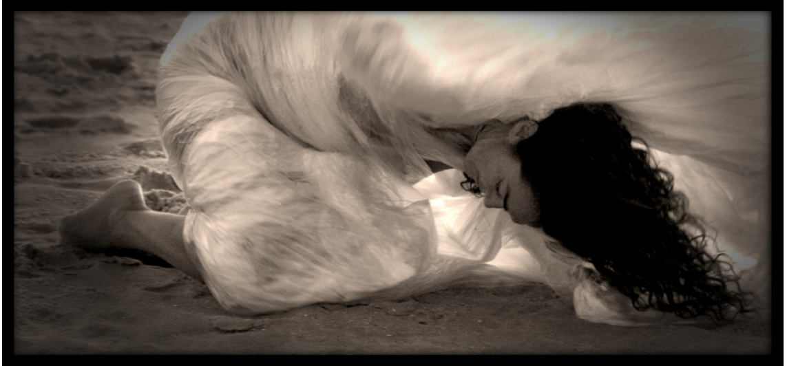
205x95 Fotografía / lienzo