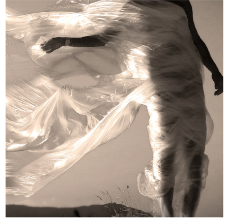
Tríptico 50x150 Fotografía / lienzo